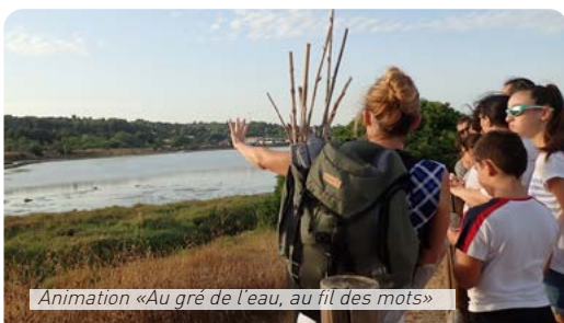
Animation «Au gré de l'eau, au fil des mots»