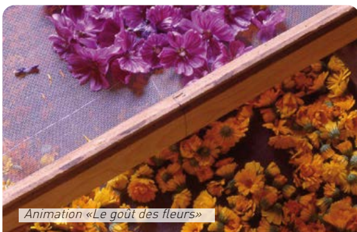
Animation «Le goût des fleurs»

RÉSERVATION : au 06 23 45 93 39 ou sur : https://bit.ly/3yRvTFA